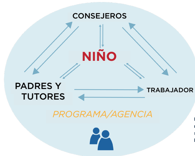
Fig. 1. Un modelo sistémico de la mentoría

Independientemente de la forma que tome la mentoría, los padres y tutores tienen un papel importante en las relaciones entre los mentores y los Jóvenes. Esta guía ofrece información que puede ayudarle a dar apoyo al proceso de mentoría. is designed to offer information that can help you support the mentoring process. La personal del programa, los mentores, los Jóvenes, y los padres y tutores todos trabajan juntos para realizar, respaldar y apoyar la relación de mentoría.